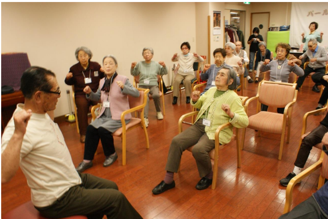
・座ったまま、前後に舟を漕ぐようにして、胸をはる姿勢でヨイショ！