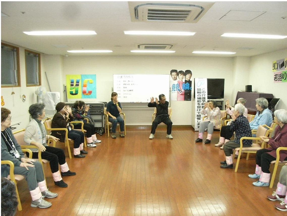
・転倒予防体操、両足に重錘をつけての“いきいき体操”です。